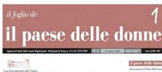
1946: il voto delle donne

Le tante redazioni femministe che ha fondato e/o diretto, il suo impegno in RAI e nelle testate come – “Radio Donna”, “Quotidiano Donna”, “Paese delle donne” in Paese Sera, e infine “Il Foglio de il Paese a generazioni di conoscermi del movimento delle ha dato un contributo a tante generazioni di donne. Le molteplici sfumature del femminismo italiano.