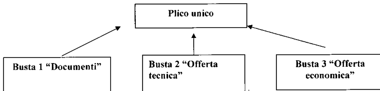
Diagramma esemplificativo del confezionamento del plico: